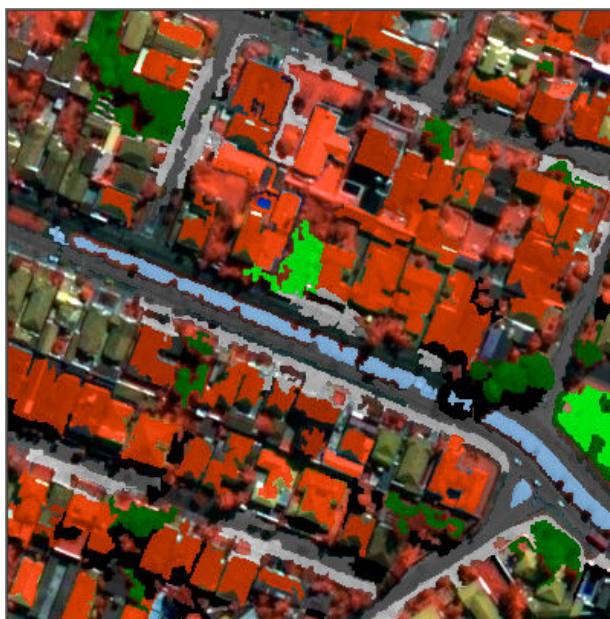
Figura 1: Classificação da imagem segmentada.

Após este processo, os dados foram exportados e neles constam o perímetro e a área de cada segmento, calculados pelo próprio eCognition®, utilizados nos cálculos do índice de dimensão fractal (D) e parâmetro de Pareto (a).